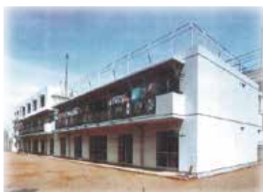
昭和62年新築当時の聖友学園

聖友ホームでは職員が話し合いを重ね、他施設を見学するなどしてきました。そして、2020年3月に設計会社を選択するプロポーザルを実施し、選ばれた設計会社と契約し、その後設計会社と聖友ホームの職員で10回のワークショップを実施し、基本設計がもうすぐ完了するところまでできました。