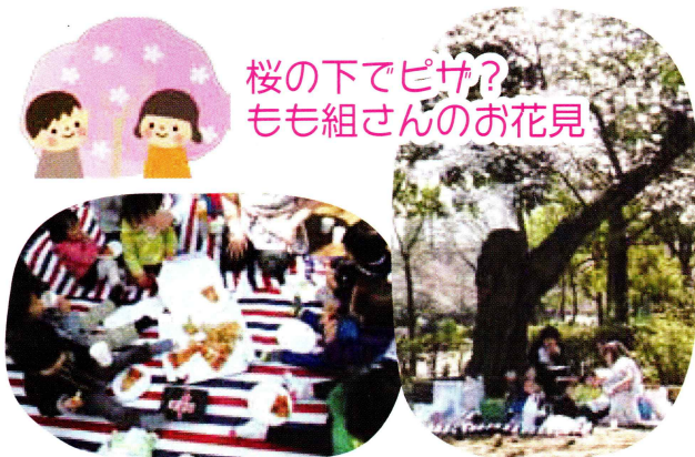
桜の下でピザ？ もも組さんのお花見

入学前、子どもたちは通学路を歩いて登下校の予行練習をしたり、書きかたの練習をしたり。職員は子どもと一緒に選んだ布で体操着袋を作ったり、持ち物に名前を書いたり。みんな準備万端ととのえて、胸ワクワクの入学式を迎えました。ランドセルを背負った晴れ姿に、職員たちは感慨もひとしお。「お姉さん、お兄さんになったね」とほめられ、子どもたちもご満悦。入学後は、勉強の大変さを多少感じているふしはあるものの、新しいお友達の中で、元気に楽しく毎日を送っています。フレッシュ、新一年生！