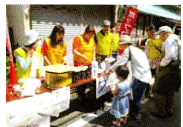
おそろいのピブス(チョッキ)を着て販売