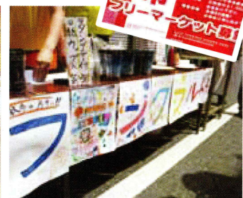
アピール効果抜群！カラフルな手作り看板

5月15日(日)朝10時、一番近い商店街である交友会が主催する「ゆうやけ市」の準備に出発、道に分別ごみのBOXやコーンを設置するお手伝いからボランティアさんと共に。それが終わると出店のためのポップコーンとフランクフルトの準備を開始します。13時からゆうやけ市がスタートすると子どもたちも参加して大きな声を出して「ポップコーンはいかがですか」と売り込み。途中近隣施設の里親支援専門相談員の方と一緒に里親募集のちらしやぴーちっこを配布し社会福祉のPRもしながら、おかげさまで完売しました。そしてラストスパートはのぼりの撤去や清掃に参加。お天気にも恵まれていい汗をかきながら地域の活動に貢献できて充実感いっぱいになりました。