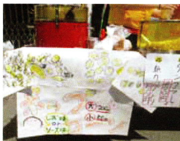
聖友ホームのポップコーンマシンも大活躍！