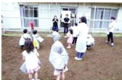
子どもたちも真剣な面もちで訓練にのぞみました