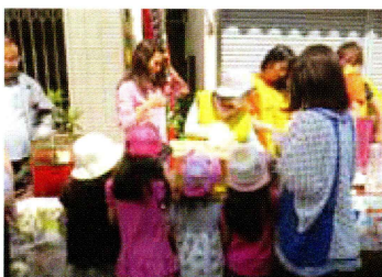
呼び込みの声に誘われて集まるお客さまたち

5月15日(日)朝10時、一番近い商店街である交友会が主催する「ゆうやけ市」の準備に出発、道に分別ごみのBOXやコーンを設置するお手伝いからボランティアさんと共に。それが終わると出店のためのポップコーンとフランクフルトの準備を開始します。13時からゆうやけ市がスタートすると子どもたちも参加して大きな声を出して「ポップコーンはいかがですか」と売り込み。途中近隣施設の里親支援専門相談員の方と一緒に里親募集のちらしやぴーちっこを配布し社会福祉のPRもしながら、おかげさまで完売しました。そしてラストスパートはのぼりの撤去や清掃に参加。お天気にも恵まれていい汗をかきながら地域の活動に貢献できて充実感いっぱいになりました。